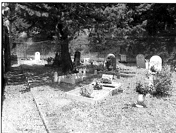
area cimiteriale interessata all'intervento