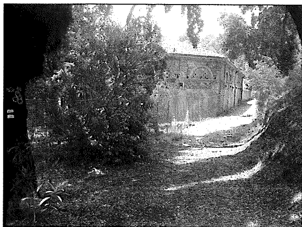
vista esterna area interessata all'intervento

Trattasi dell'area a forma triangolare adibita a sepoltura a terra posta lungo lato dell'ottagono cimiteriale a destra dell'ingresso principale, area accessibile dall'interno e attualmente transennata in quanto priva di muro di cinta smontato per motivi di sicurezza in data 21 novembre 2004.