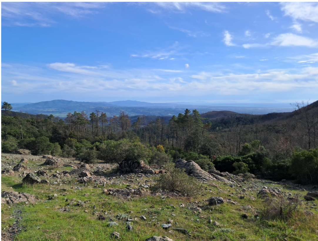
Immagine punto panoramico verso il mare con parco eolico alle spalle . Su questo panorama verranno inserite due nuove pale da 136 ml !!