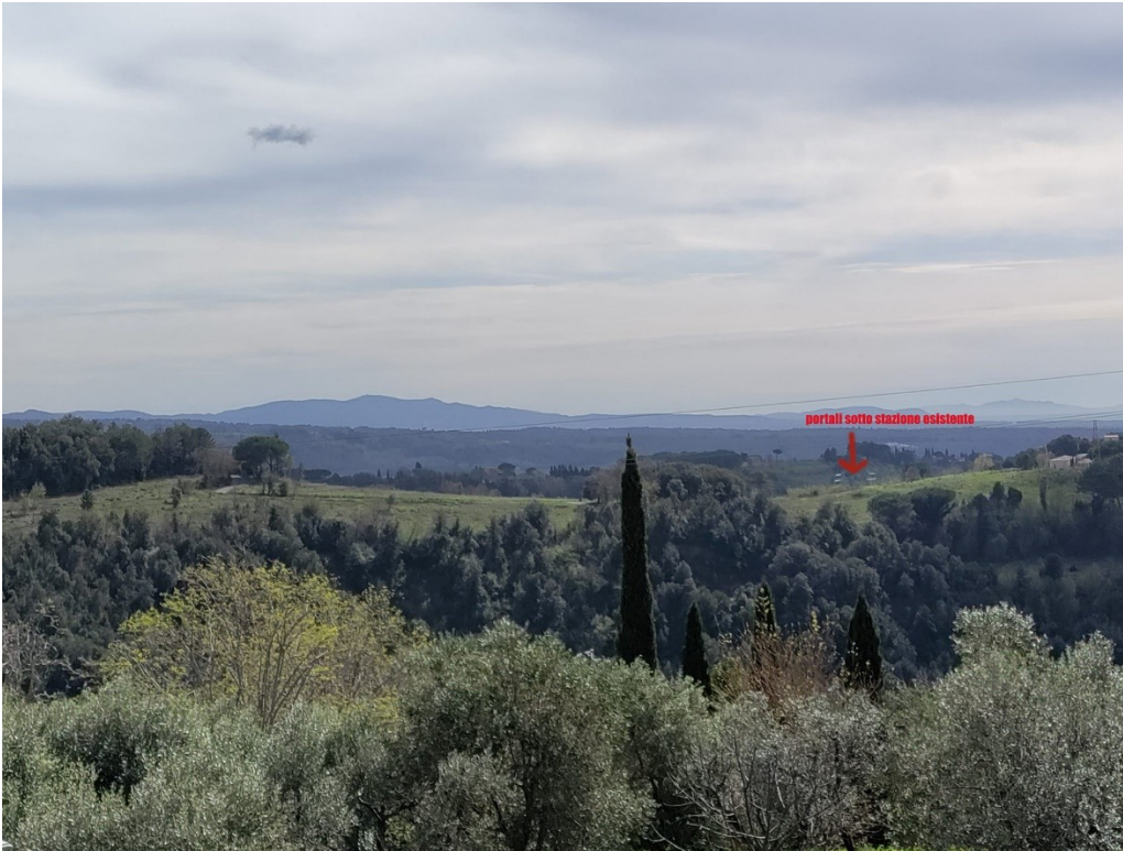
Immagine per foto inserimento della nuova sottostazione ( da punto panoramico nel centro di Riparbella)

Salita parcheggio via degli orti punto panoramico : https://maps.app.goo.gl/G8rSZBntPGEQ6Zqz7